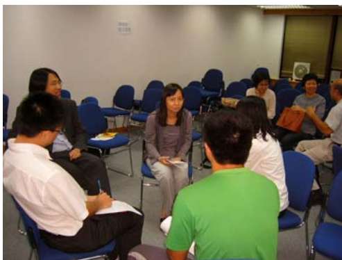
研習生活經歷（在工作坊）

當聽到 K 對遲到的案主會再約時間，是基於不想影響下一個案主的面談，我卻有不同的看法並甚少有如此安排。因為我對案主的遲到是十分容忍的，或許是我也有遲到的習慣。從過往不同階段的輔導生涯裡，我都是基於實際考慮去接納案主的遲到的，並不是什麼冠冕堂皇的從案主角度去考慮其遲到的原因。記得還是新丁時，對案主的應約總是誠惶誠恐，珍而重之，因為有得見總好過無得見。加上在家庭服務中心的工作是頗為繁重，因此對案主的應約是極其重視，甚至大喜過望，並不在乎能否準時。這樣的心態當然並不是真心對案主的遲到作出容忍，只是尋求盡快解決問題，然後結案收工！我相信應約的案主就能夠對作出改變，而爽約的案主，等同對自己問題毫無改變動機，更甚者要三催四請才能再另約日子，真是惱人。到後期學會從案主角度去理解他們遲到的原因，並了解他們準時的難處，更加沒有要求擇日重見。如今這種包容的態度一直在潛移默化，加上從敘事技巧中學會對遲到者產生好奇心，使能建立最佳的互信互重的關係。因此遲到究竟是怎樣開始纏繞著我們，而習慣遲到的人又怎樣被愛遲到控制，若我們能釋放遲到這個問題，便能多一點明白遲到的人的原因。